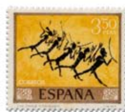
9.- Guerreros. Cueva Mola Remigia, Castellón. Sello de abril 1967