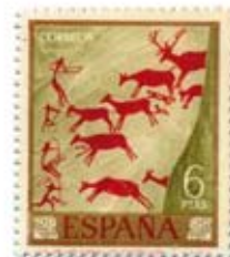
10.- Cacería. Cueva los Caballos, Castellón. Sello de marzo 1967