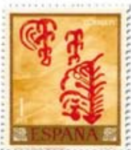
14.- Ideogramas. Cueva La Silla, Badajoz. Sello de abril 1967

Molero y el abrigo Les Dogues. Llama la atención, en una de ellas, la pintura que representa la ejecución de un conde-nado.