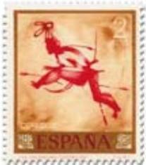
11.- Guerrero abatido. Cueva Saltadora, Castellón. Sello de abril 1967