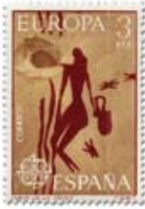
12.- Recogida de miel. Cueva de la Araña, Valencia. Sello de 1975