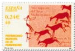
13.- Arte Rupestre de Levante. Patrimonio Cultural desde 1998. Sello de 2001