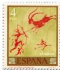
8.- Caza de cabra. Cueva Remigia, Castellón. Sello de abril de 1967