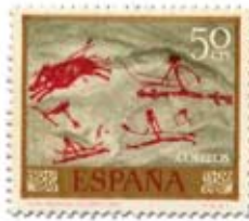
7.- Caza del jabalí. Cueva Remigia, Castellón. Sello de abril 1967