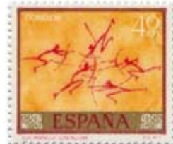
6.- Arqueros. Cueva de Morella, Castellón. Sello de abril 1967

Representa una escena de la caza del jabalí por varios arqueros, en la Cueva Remigia, Barranco de Gasulla, en Ares